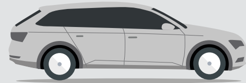
Skoda Octavia Combi 85KW / 115PS - konventionell